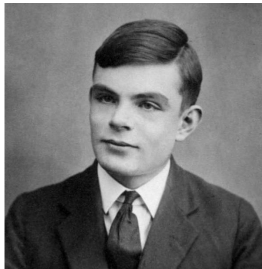
Alan Turing all'età di 16 anni

Il test di Turing si basa sul presupposto che una macchina si sostituisca ad “A”: se la percentuale di volte in cui “C” indovina chi sia l'uomo e chi la donna è simile prima e dopo la sostituzione di “A” con la macchina, allora la macchina stessa dovrebbe essere considerata intelligente, dal momento che - in tale situazione - risulterebbe indistinguibile dall'essere umano “A”.